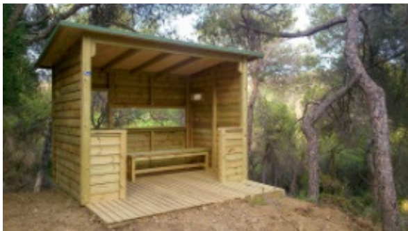
Mirador de pájaros instalado en la Ruta Forestal.