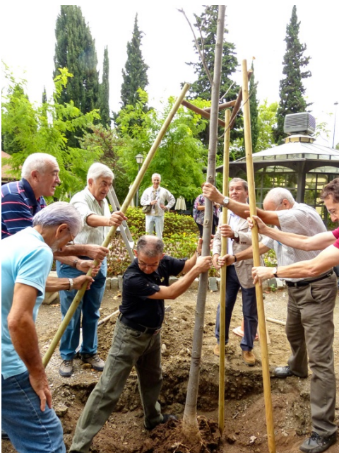
Plantación de un Tulípero de Virginia, con motivo de nuestra Asamblea de octubre.