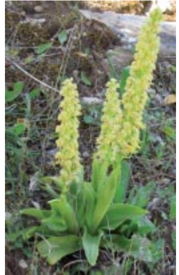
Foto nº 10 Neotinea intacta . Sierra Alhaurín el Grande.