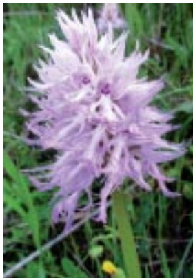
Foto nº 9 Orchis italica . Arroyo Jaboneros.