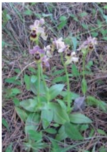
Foto nº 2 Agrupación de Ophrys tenthredinifera . La Concepción.