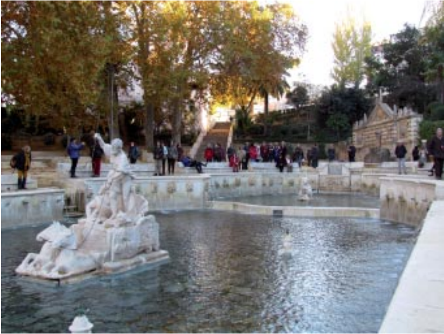
Priego de Córdoba