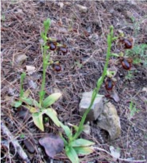
Foto nº 4 Ophrys speculum . La Concepción.

La última de las que tenemos localizadas es Orchis papilionacea , Se encuentra por la parte más alta de la finca y es la más fácil de ver, tanto por su color púrpura, que destaca y llama la atención desde lejos, como por su gran porte (desde 15 a 45 centímetros), pero este año, seguramente por la falta de lluvia, no ha florecido en La Concepción. Las fotografías 5 y 6, tomadas en el Arroyo Jaboneros, muy cerca de Málaga también, nos muestran dos variantes a cual más bella de su labelo. Ambos presentan sus características nervaduras más oscuras, pero en un caso el fondo es rosa y en el otro casi blanco.