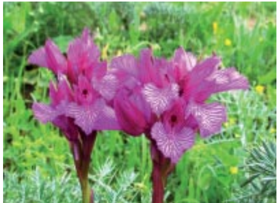
Foto nº 6 Orchis papilionacea . Arroyo Jaboneros.