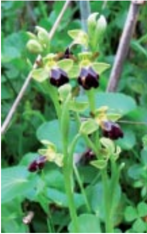
Foto nº 7 Ophrys fusca . Arroyo Jaboneros.

El año que viene continuaremos buscando a fondo por la finca porque no nos extrañaría que, además de las cuatro especies anteriores, se den al menos otras dos especies poco exigentes del primero de los géneros ( Ophrys fusca y Ophrys lutea ), bastante comunes en nuestros montes. Son las de las fotografías 7 (portada) y 8.