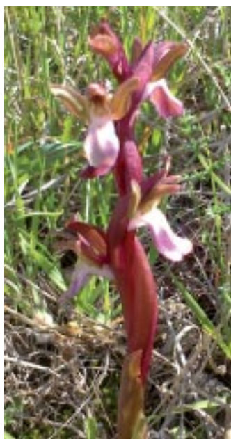
Foto nº 1 Orchis collina . Canillas de Aceituno.

Hacia febrero o marzo florece O. tenthredinifera (con ese nombre tan complicado no es de extrañar que las llamen “abejitas”), aunque en enero ya pude este año localizar alguna roseta de hojas que las anunciaban. Es la más abundante y, como se ve en la fotografía 2, se agrupan, haciéndose más fácilmente localizables. Llamen la atención sus sépalos y pétalos de color rosa más o menos intenso y su labelo amarillento con la zona central de color pardo oscuro bordeado de una franja pilosa de color amarillo o amarillo verdoso y con una característica lengüeta en el centro del borde inferior, como se ve en la fotografía 3. Aunque pueden alcanzar hasta 60 cm, las nuestras no llegaban a los 30.