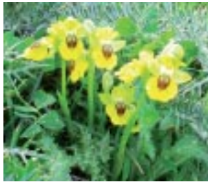
Foto nº 8 Ophrys lutea . Santopitar.