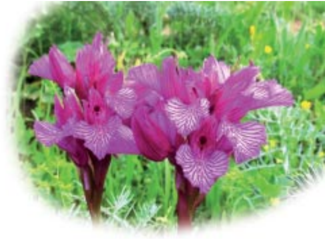
Orchis papilionacea . Arroyo Jaboneros.