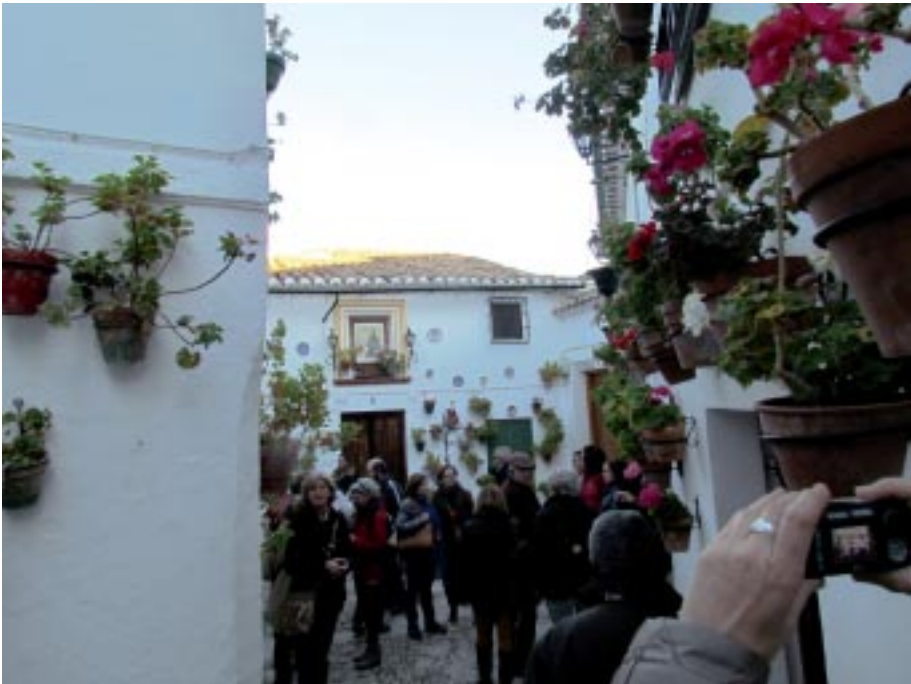
Priego de Córdoba