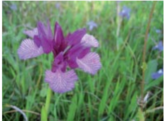
Foto nº 5 Orchis papilionacea . Arroyo Jaboneros.