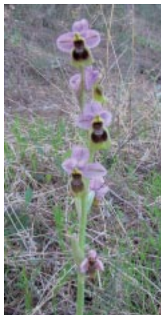
Foto nº 3 Precioso ejemplar de Ophrys tenthredinifera . La Concepción.