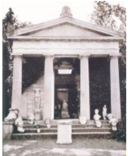
El Loringiano con la famosa Urania en el centro.