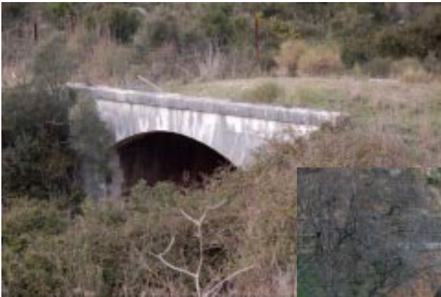
Puente de Garrayo.

El camino que nosotros seguimos desde Villanueva hasta la Boca del Asno permite ver muchos restos de la antigua obra, sobre todo dos espléndidos puentes: el del Paraíso y el de Garrayo.