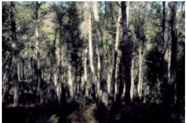
Pinar en el Parque Natural de los Montes de Málaga.

El 21 de Abril hicimos la visita de todos los años al Mirador “Vázquez Sell” en el que los Amigos hemos plantado encinas, pinos, almeces, tilos, madroños,...y donde algunos socios se esmeran todo el año. Luego dimos una vuelta por los alrededores.