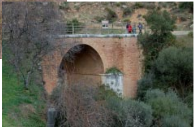
Puente del Paraíso.