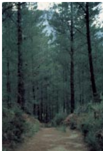
Bosque de pinos de Monterrey.