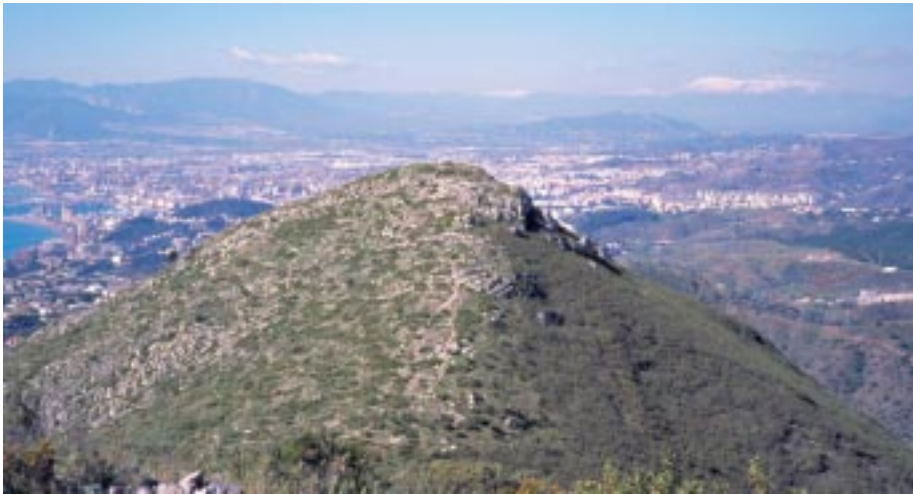
Desde la cumbre Oeste del San Antón.