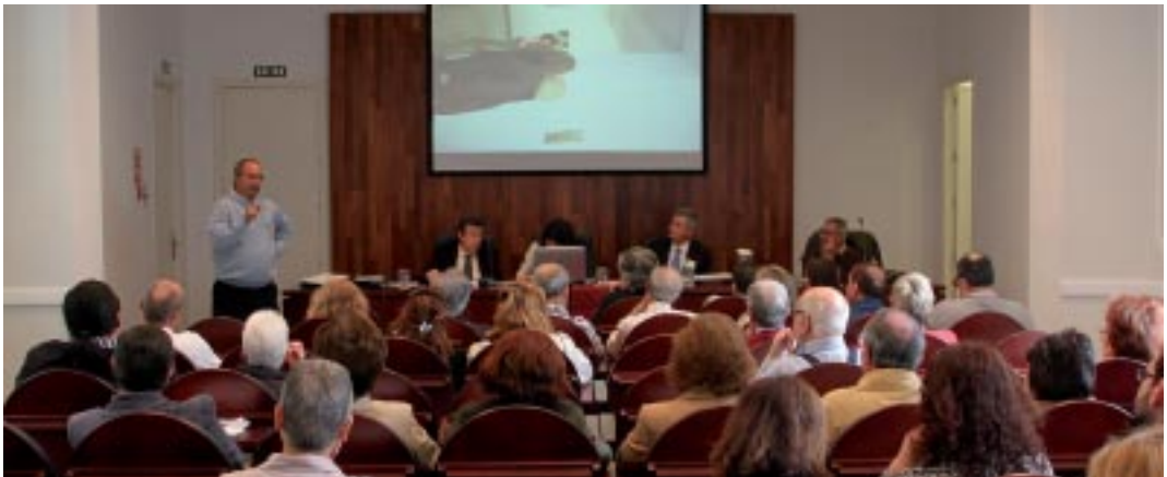
Asistentes a la Asamblea.

Terminó la Asamblea con el refrigerio habitual de confraternización.