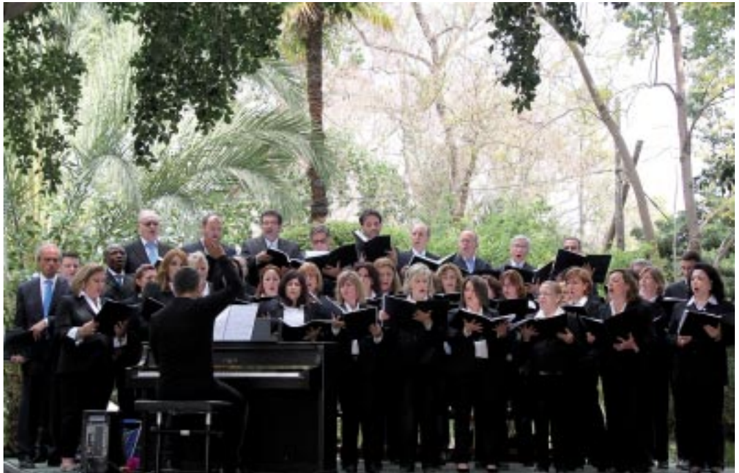
Coro del Colegio de Abogados.