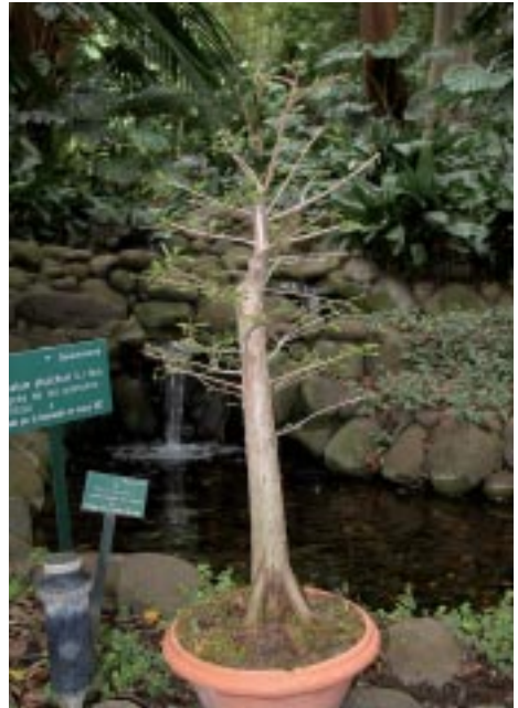
"Ciprés de los pantanos".