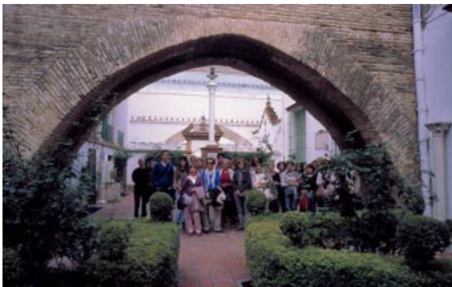
Grupo de Amigos en un arco de las antiguas Atarazanas sobre una parte de las cuales se edificó la Santa Caridad.

Visitamos las “setas” o la “hidra”, de la Plaza de la Encarnación y de nombre “Metropol Parasol”. Su autor Jürgen Mayer ha dispuesto sobre grandes columnas de hormigón (de 26 metros de altura), seis pasarelas en cinco niveles mediante placas de madera. Debajo se ha excavado una parte de la Sevilla romana, el Antiquarium.