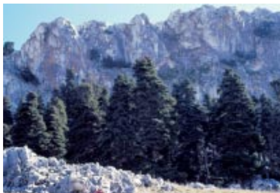
Pinsapar del Peñón de Ronda.

Fuimos el 18 de Febrero y el día anterior había nevado por lo que el carril estaba embarrado y deslizante. Pudimos llegar a los Sauces y nos hizo un día magnífico. Fuimos hasta el Cortijo del Palancar, rodeamos el Peñón y bajamos por la Cañada de la Encina. La vista de los pinsapares nevados era esplendorosa.