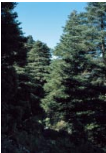
Pinsapar del Puerto de Pozuelo.

El sábado día 10 de Diciembre fuimos a Sierra Blanca. Desde el Parador de Juanar (construido en la época de Fraga después de eliminar totalmente el refugio de caza que mandó edificar el Marqués de Larios; vaya destrozo) ascendimos al Puerto del Pozuelo donde está el pinsapar más meridional. Luego seguimos por la ladera de Sierra Canucha hasta el camino que viene de Istán. Bajamos por el precioso pinar de repoblación de pinos de Monterrey ( Pinus radiata ).