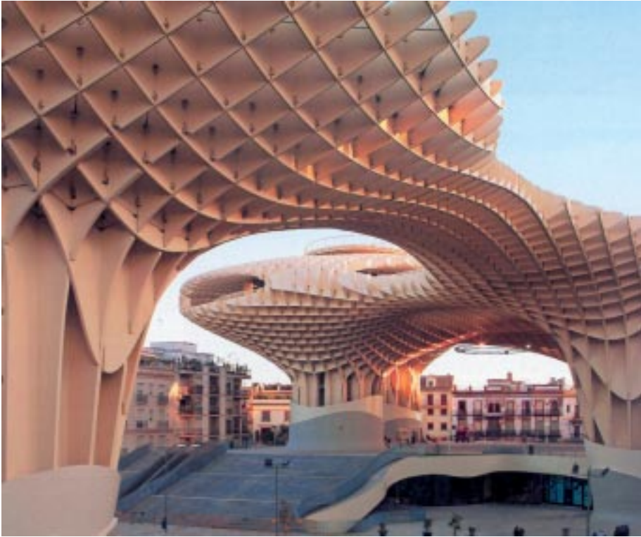
Setas o hidra de la Plaza de la Encarnación.

El domingo fuimos al Castillo de San Jorge, junto al Puente de Triana. Era la sede del infausto Tribunal de la Inquisición. Se ha rehabilitado primorosamente y el recorrido, muy bien explicado, nos sumerge en esta terrible institución.