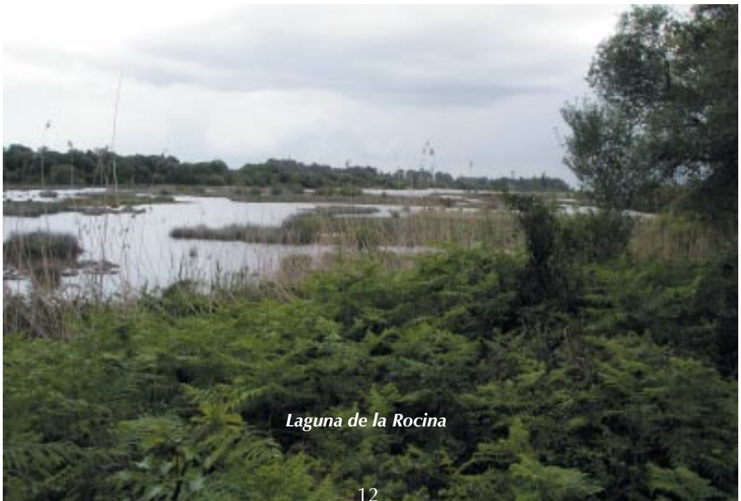
Laguna de la Rocina

Los días 19 y 20 de Abril nada menos que 109 “amigos” fuimos a Doñana. Nos llovió un poco, algunos dirán que un mucho. El sábado entre chaparrones y claros hicimos el itinerario de La Rocina por la mañana; por la tarde vimos el Museo de las ballenas pero el recorrido de la Duna del Asperillo sólo unos veinte pues la mayoría prefirió quedarse en el hotel, en seco. La cierto es que en ese último recorrido no nos llovió nada y es una pena que no vieran un paisaje tan extraordinario. El domingo ya el sol se asomó lo suficiente como para que pudiéramos hacer los itinerarios del interior del Parque Nacional en los autobusitos todo-terreno con tranquilidad. Pudimos ver también el palacetepastel del Acebrón y hacer el recorrido del Charco de Idem.