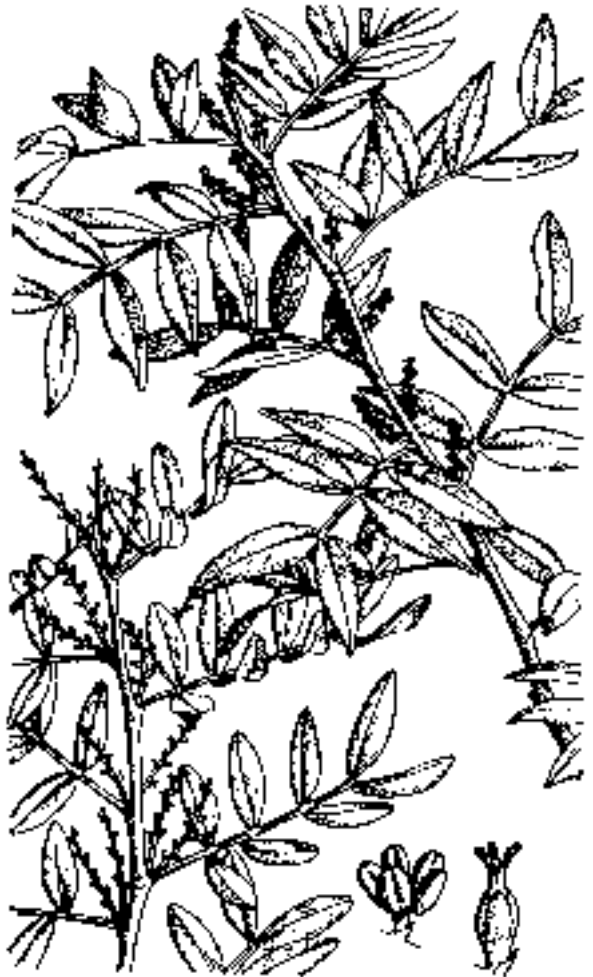
Leñisco ( Juniperus lewisii ), ramitas del pie masculino (arriba) y del pie femenino (abajo), con una flor macho y otra hembra vistas con mayor aumento. (Original; de Sieber)

Enebro ( Juniperus oxycedrus L. ) tiene las hojas aciculares pinchudas, los frutos son bayas de color rojizo. Todo tipo de suelos menos los muy encharcados, prefiriendo los sueltos a los compactos tipo arcillosos. Aguanta precipitaciones desde 300 mm. en adelante. Se puede utilizar desde el nivel del mar hasta los 1500 metros de altitud. Prefiere la luz y tiene un temperamento robusto. Crecimiento lento y gran longevidad. Madera rojiza de grano fino, con un olor aromático muy agradable, se utilizó en la fabricación de lápices y en la construcción. Mediante destilación se obtiene el aceite de enebro para aplicaciones medicinales. Puede emplearse en setos y barreras cortavientos, aunque como más luce es aislado con su porte natural. De un primo suyo, el Juniperus communis , enebro común, se obtiene la ginebra.