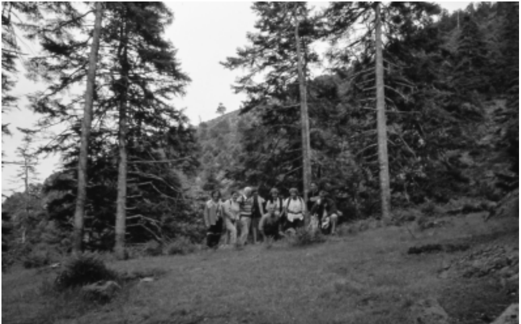
Amigos en el pinsapar de los Reales

Al día siguiente fuimos a la Saucedá. La mitad hicieron un recorrido corto y la otra subimos hasta el Pico del Aljibe. El objetivo principal era ver la floración de los rododendros y efectivamente estaban en flor. Esplendorosos. Tuvimos un tiempo excelente ambos días. Lástima que sólo fueran dieciocho a una excursión tan magnífica.