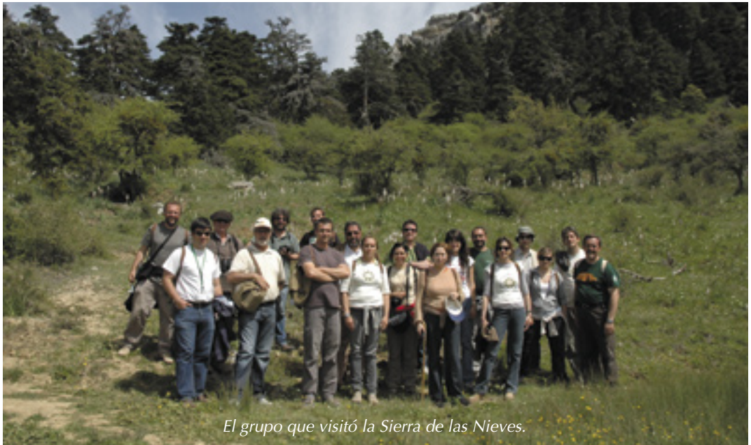
El grupo que visitó la Sierra de las Nieves.

Hay que decir que el encuentro ha concluido siendo un éxito absoluto, las felicitaciones recibidas han sido abrumadoras. Todo salió casi mejor de lo esperado, el tiempo magnífico, los almuerzos bajo las glicinias encantadores y los extras (como una copa de bienvenida en el castillo de Gibralfaro, un paseo guiado por la ciudad o la cena de clausura) quedaron más que perfectos.