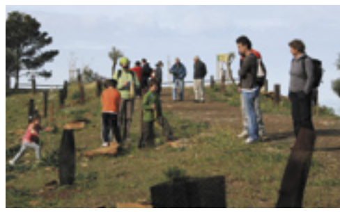
Subiendo por la Cañada del Cuerno en la Sierra de las Nieves.