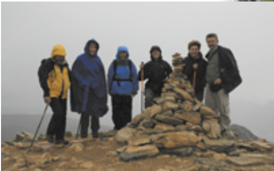
Por la Cañada de las Ánimas en la Sierra de las Nieves.