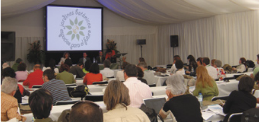
Carpa donde se celebraron las conferencias.

Durante los días 5, 6 y 7 de mayo hemos tenido la suerte de reunir en La Concepción a más de 100 personas ligadas al mundo de la naturaleza y los jardines botánicos (en adelante JB).