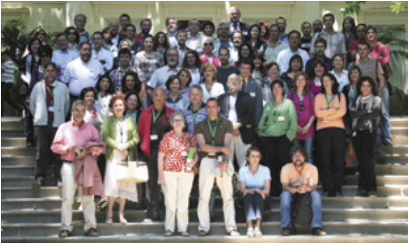
Parte de los asistentes al Symposium.

Los asistentes encontraron el jardín excelente, resaltando su belleza y esmerado cuidado, cosa que hemos de agradecer al equipo de jardineros de La Concepción y a la Escuela Taller, que hizo un gran esfuerzo para tener sus zonas lo mejor posibles.