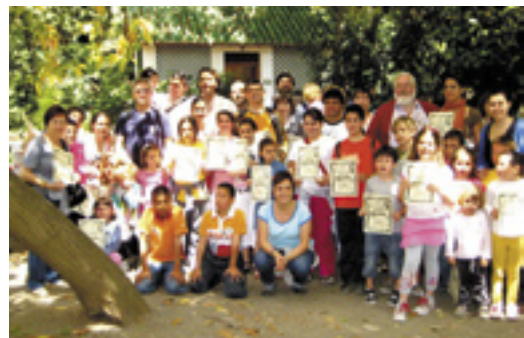
Muchos de los participantes en el Gran Juego.

Los premiados podrán recoger el regalo correspondiente el sábado, día 3 de octubre de 2010, en la Asamblea ordinaria que celebrará la Asociación de Amigos de La Concepción para sus socios.