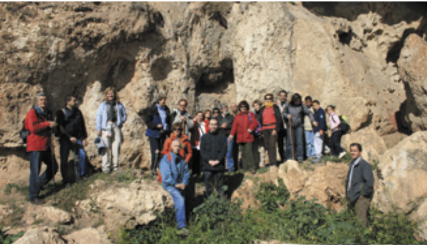
En las Cuevas de la Araña.