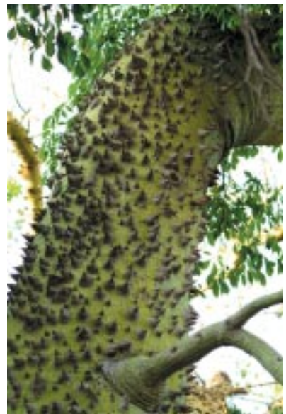
Tronco verde (con clorofila) y aguijones de Ceiba chodatii

Las ceibas, en general, son árboles de gran tamaño que pueden alcanzar 20 o más metros de altura, aunque también hay especies de menor tamaño. Los troncos en ocasiones están hinchados en la parte inferior, alcanzando un diámetro considerable, debido a que almacenan agua que aprovechan en los meses de sequía, de ello deriva el nombre vulgar de barrigudo, árbol botella o palo borracho con que se les conoce.