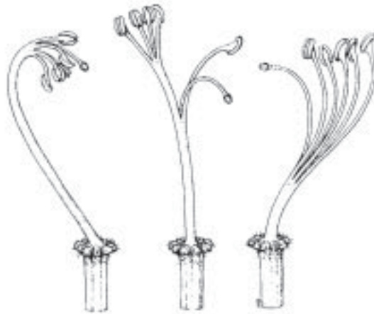
Fig. 2. Variaciones del tubo estaminal de Chorisia speciosa (Adaptado de GIBBS & col. 1988)

estaminal en flores del mismo árbol. Algunas flores presentaban todos los estambres soldados y otras tenían 2 a 5 estambres libres en el tercio o mitad superior (Fig. 2).