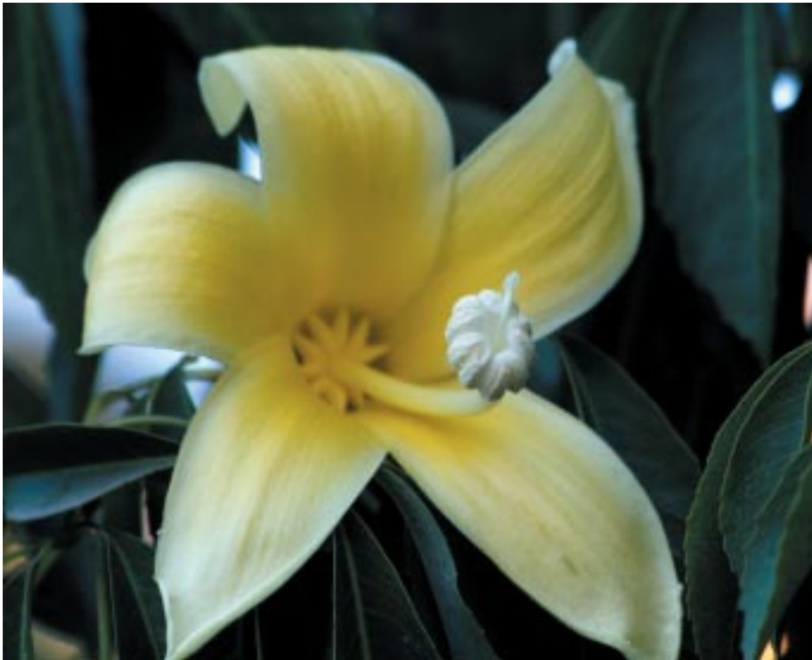
Ceiba chodatii (Hassl.) Ravenna Avda. M. Agustín Heredia (Plaza del poeta Alfonso Canales)