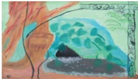
Obras de los menores de 15 años