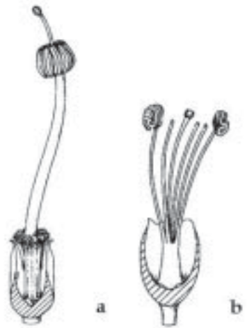
Fig. 1. a) Tubo estaminal con apéndices bilobados en la base y los filamentos de los estambres soldados de Ceiba insignis ( Chorisia insignis ), b) tubo estaminal con los filamentos de los estambres libres de Ceiba pentandra . (Adaptado de GIBBS & col. 1988)

Estos caracteres que parecen claros y precisos, no lo son tanto cuando se analizan todas las especies descritas y así lo hicieron GIBBS & col. (1988) demostrando que los atributos empleados para distinguir ambos géneros no eran muy consistentes. Así, por ejemplo, observando la variación de poblaciones de Chorisia speciosa del sureste del Brasil, los mencionados autores comprobaron la variación de la morfología de la columna