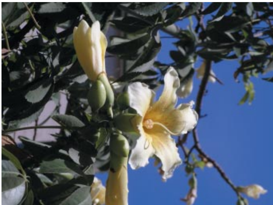
Probablemente se trate de Ceiba insignis (Kunth) P.E. Gibbs & Semir. Plaza Carrascón

Sobre la presencia de Ceiba insignis , cuyas flores son de color blanco o rosa pálido, hemos observado algún ejemplar que se aproxima a esta especie, como el que está en la Plaza Carrascón, junto a la antigua estación de ferrocarriles del Palo, cuyos pétalos son de color blanco con estriaciones rosadas, bordes algo ondulados y muy vellosos externamente. Es posible que también se trate de un híbrido con algunas de las especies anteriormente mencionadas.