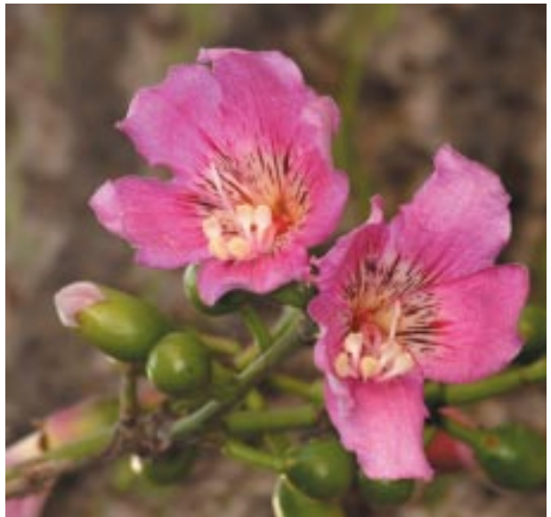
Ceiba pubiflora (A. St.-Hil.) K. Schum. Parque de Málaga

Ceiba pubiflora . Se conoce con los nombres de: barrigudo, árbol botella, palo borracho y es originaria de Sudamérica (Argentina, Paraguay y centro-oeste de Brasil). La mayoría de los ejemplares del Parque corresponden a esta especie que es la más tardía en florecer en Málaga (bien entrado el otoño). También hay ejemplares cultivados en la acera del Hospital Materno y en la Plaza de Gue-