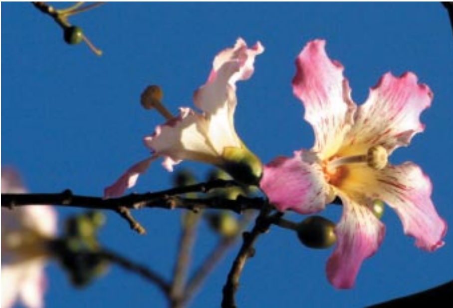
Ceiba speciosa (A. St.-Hil.) Ravenna. Oficina de Turismo del Ayuntamiento

Es la especie más cultivada como ornamental en numerosas calles y jardines de Málaga, observándose una gran variabilidad en el colorido, tamaño y forma de los pétalos, que pueden ser rosados, rojizos o amarillentos. Muchos de los ejemplares cultivados son de viveros y la variabilidad en muchos casos procede de la hibridación con otras especies. En el Parque de Málaga, en la isleta donde se encuentra la Oficina de Turismo del Ayuntamiento (antigua Casa del Jardinero Mayor), el ejemplar de menor altura corresponde a esta especie, mientras que el más alto es Ceiba pubiflora .